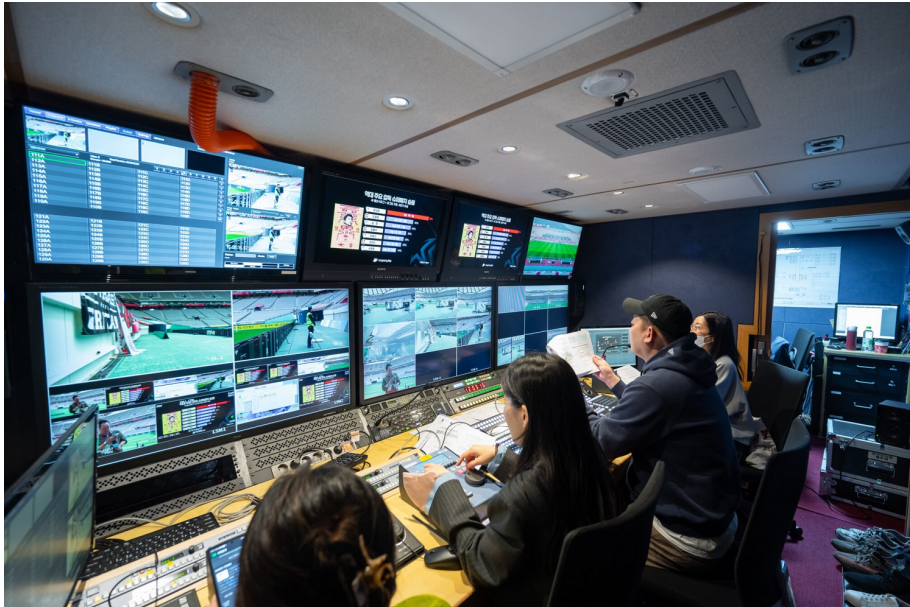
쿠팡플레이 중계차 내부. 다양한 분석 화면과 함께 중계를 준비하는 중이다.