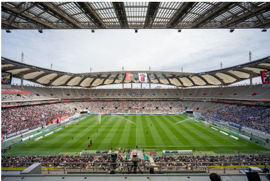
지난 4월 22일, 서울월드컵경기장에서 펼쳐진 FC서울 대 수원삼성블루윙즈 경기. 쿠팡플레이가 쿠팡픽으로 선정했다.

쿠팡플레이의 경기는 휘슬이 울린다고 끝이 아닙니다. 쿠팡플레이 팀은 하이라이트 영상을 업로드 하는 등 경기 이후에도 고객들이 여흥을 즐길 수 있게 돕습니다. 스포츠와 관련된 다양한 다큐멘터리, 영화, TV 프로그램들을 쿠팡플레이에 준비해둔 것은 물론이죠.