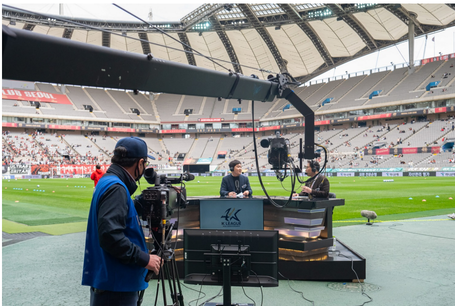
경기장 내 설치된 쿠팡픽 프리뷰쇼 데스크

고객을 ‘WOW’하게 만들겠다는 목표를 가진만큼 출발부터 남들과 달랐습니다. 일반적인 방송국들은 K리그 개막 한두 달 전부터 준비를 시작하지만, 쿠팡플레이 스포츠팀은 1년 전부터 방송을 준비했습니다.