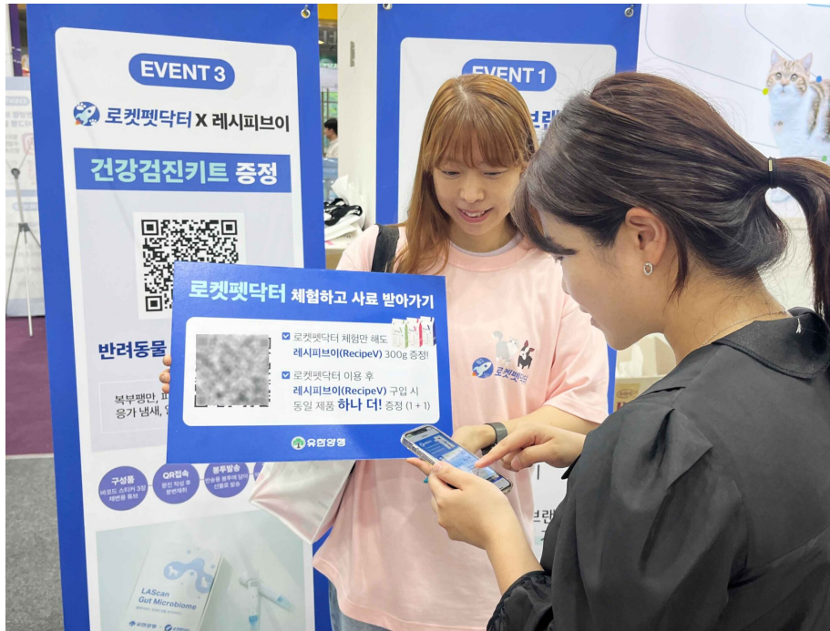
캣박람회에서 로켓펫닥터 이벤트에 참여하고 있는 소비자

로켓펫닥터는 5월 론칭 이후 한 달 만에 참여율이 152% 증가하는 등 빠르게 성장하고 있다. 현재 유한양행, 힐스 사이언스다이아트, 세니메드, 포르자 등 국내외 유명 브랜드 제품이 입점해 있어 수의사 진단 결과와 연계하여 추천하고 있으며 지속적으로 입점 브랜드 확대에 나서고 있다.