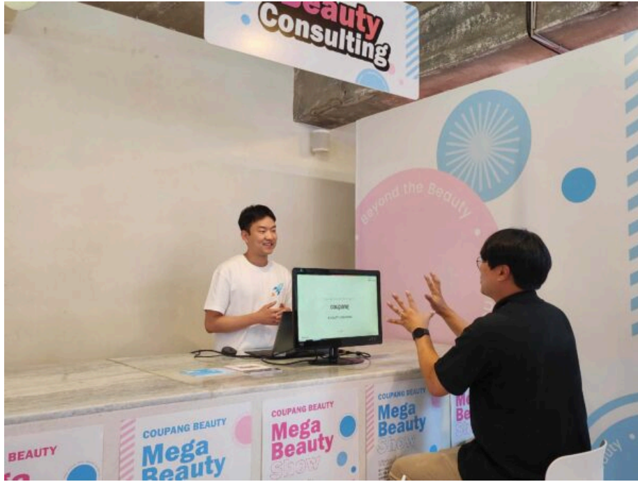
쿠팡 버추얼 스토어에 마련된 중소기업 컨설팅 부스 모습