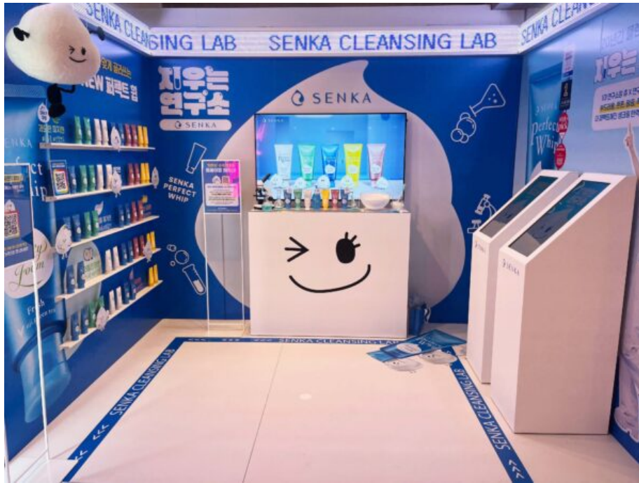
쿠팡 뷰티 버추얼스토어에 참여한 센카 부스 모습