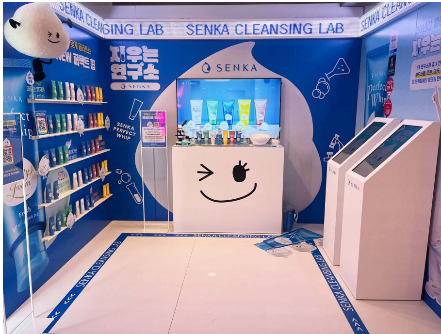
쿠팡 뷰티 버추얼스토어에 참여한 센카 부스 모습