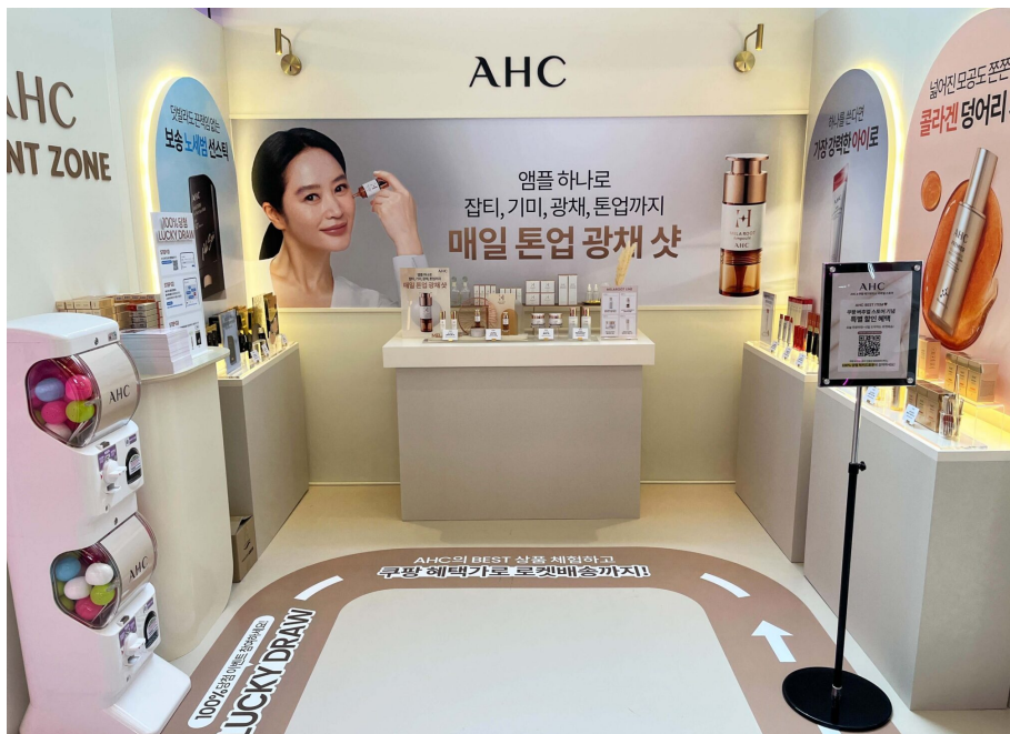
쿠팡 뷰티 버추얼스토어에 참여한 AHC 부스 모습