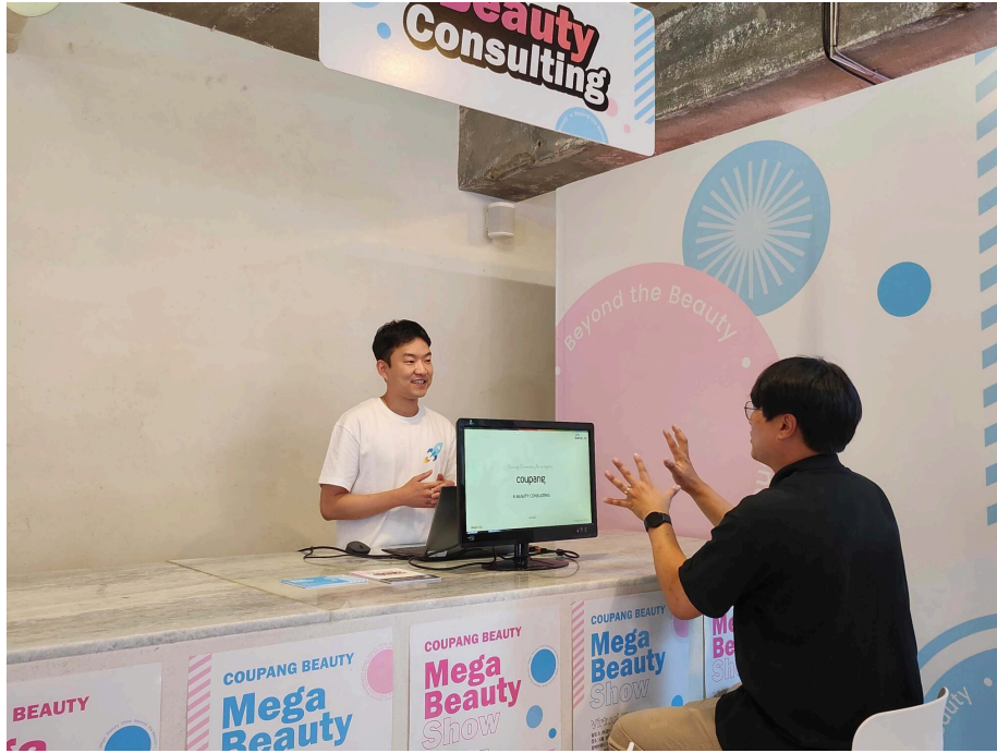
쿠팡 버추얼 스토어에 마련된 중소기업 컨설팅 부스 모습