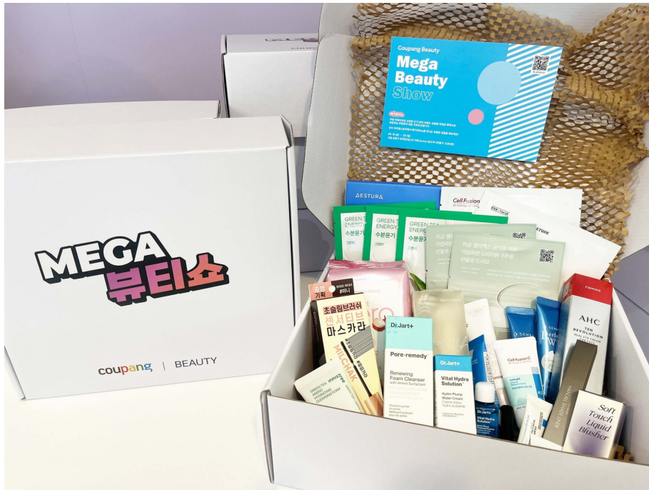
사전 예약 고객 대상이 2만원 이상 제품 구매시 13만원 상당의 뷰티박스를 제공한다.