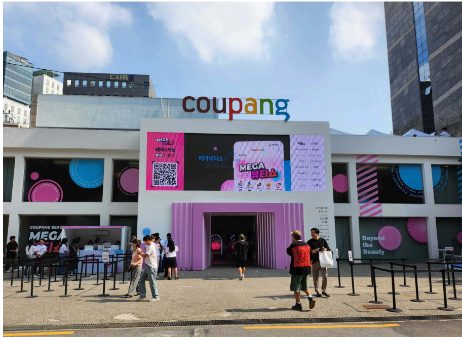
쿠팡 뷰티 버추얼스토어 전경. 고객 감사 차원으로 3일간 진행한다