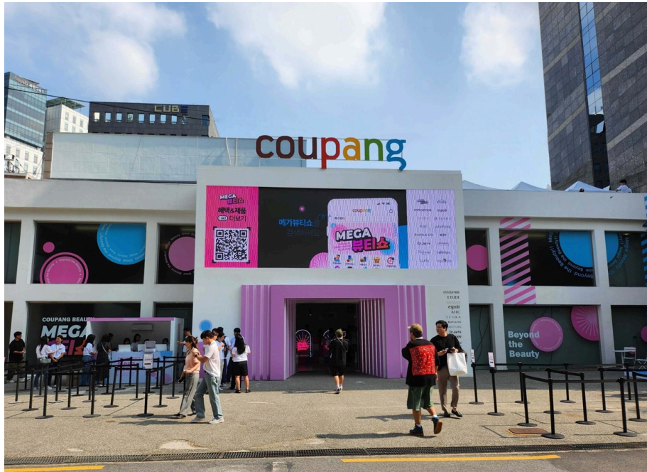
쿠팡 뷰티 버추얼스토어 전경. 고객 감사 차원으로 3일간 진행한다