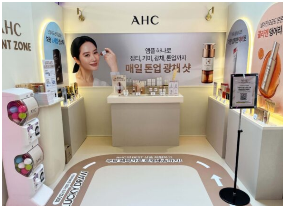
쿠팡 뷰티 버추얼스토어에 참여한 AHC 부스 모습