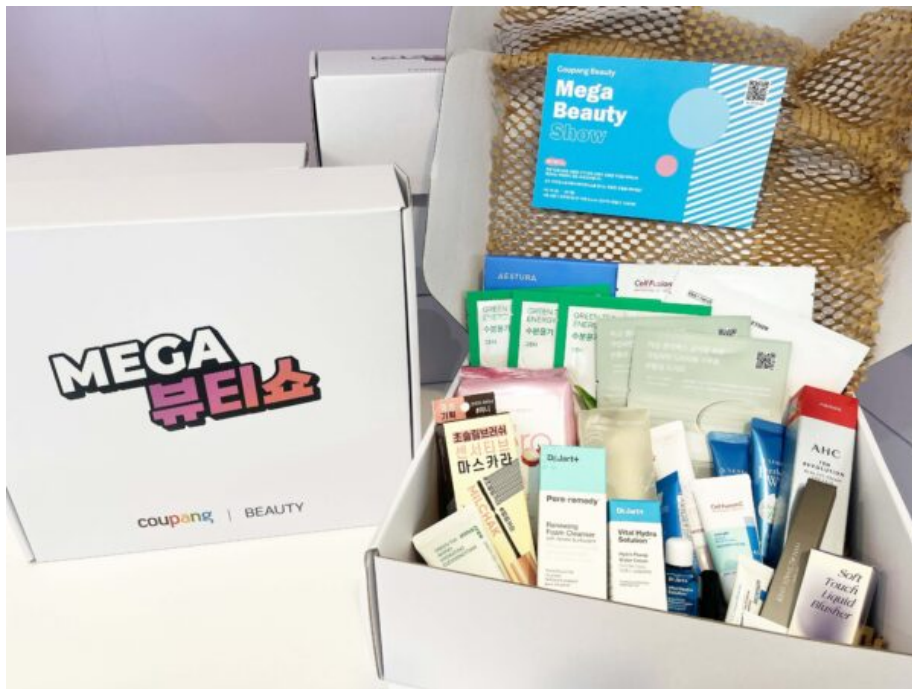
사전 예약 고객 대상이 2만원 이상 제품 구매시 13만원 상당의 뷰티박스를 제공한다.