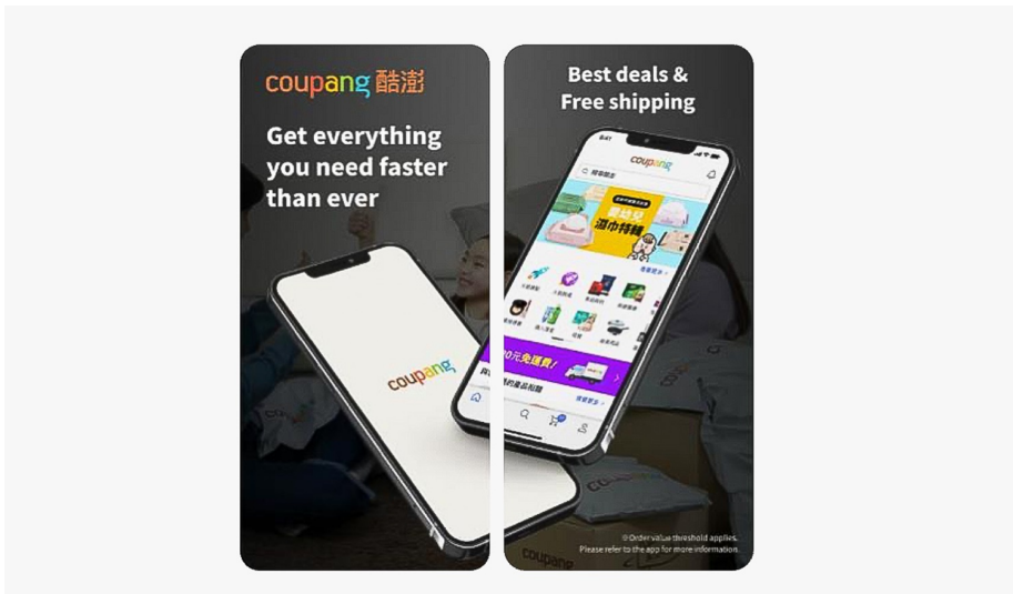
쿠팡 대만 앱