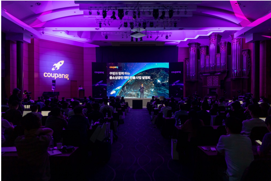
9월 18일 서울 양재동 엘타워에서 진행된 '쿠팡과 함께하는 중소기업인 대만 진출 사업설명회'