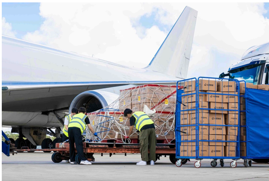
물류센터에서 출발한 상품은 인천국제공항을 지나 대만 고객에게로 향한다

또한, 대만 고객은 로켓직구를 통해 한국에서처럼 다양한 제품을 합리적인 가격에 구매할 수 있습니다. 쿠팡 대만 앱의 로켓직구 탭에는 식품, 화장품 등 수백만 종의 인기 한국 상품들이 등록돼 있습니다. 무료 배송 기준 금액도 다른 국제 배송 서비스 대비 낮은 편입니다. 690 TWD, 한화로 2만 8천 원 정도입니다.