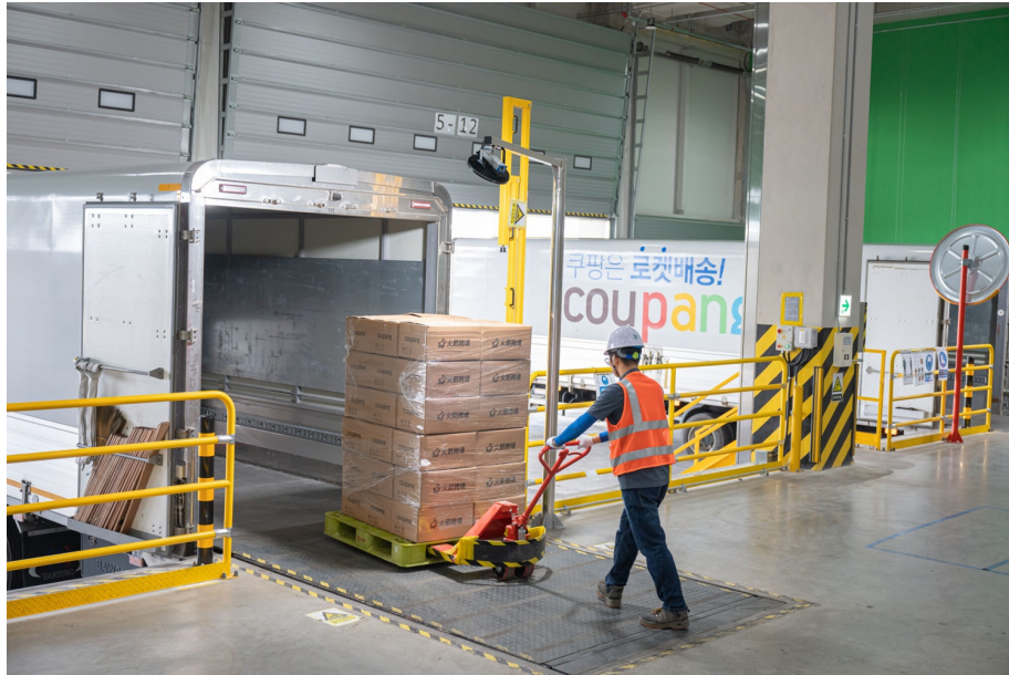
국내 물류센터에서 공항으로 이동할 상품을 정리 중이다

쿠팡의 AI 시스템은 주문이 들어오면 최단 배송 동선을 계산합니다. 순식간에 최적의 물류센터를 찾아내죠. 국내 물류센터에서 출발 준비가 끝나면 상품은 가장 빠른 일정의 대만행 비행기에 실려 고객에게 배송됩니다. 그리고 이 모든 배송 과정은 고객에게 자세하게 안내됩니다.