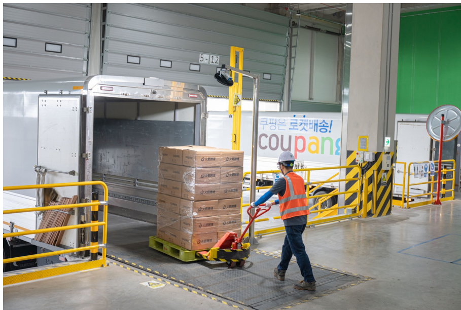
국내 물류센터에서 공항으로 이동할 상품을 정리 중이다

쿠팡의 AI 시스템은 주문이 들어오면 최단 배송 동선을 계산합니다. 순식간에 최적의 물류센터를 찾아내죠. 국내 물류센터에서 출발 준비가 끝나면 상품은 가장 빠른 일정의 대만행 비행기에 실려 고객에게 배송됩니다. 그리고 이 모든 배송 과정은 고객에게 자세하게 안내됩니다.