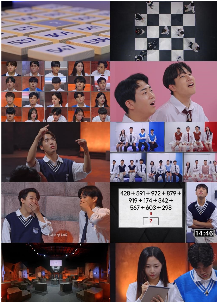
쿠팡플레이 '대학전쟁' 관련 이미지.