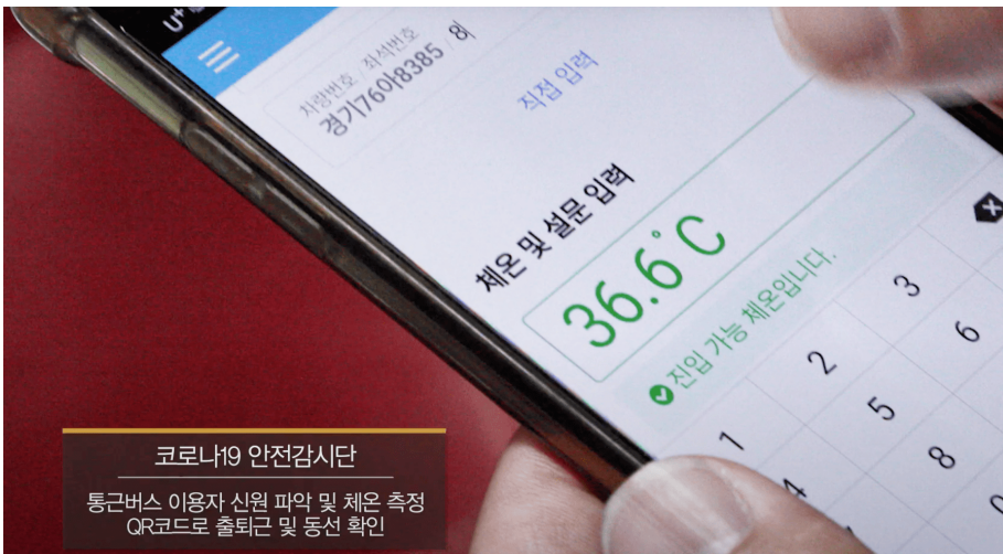
코로나19 안전감시단 통근버스 이용자 신원 파악 및 체온 측정 QR코드로 출퇴근 및 동선 확인

직원들의 통근버스도 중요한 관리 대상입니다. 쿠팡은 물류센터를 오가는 통근버스를 두 배가량 증차해 두 좌석당 한 명이 앉을 수 있도록 했습니다. 또 통근버스 승하차 및 사업장 출퇴근 시 QR코드를 사용해 체온 및 건강 기록을 관리해 코로나 의심자 발생 시 신속하게 동선 추적할 수 있습니다.