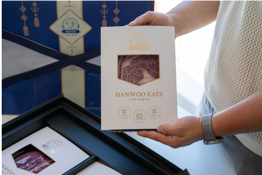
1++등급 마장동 한우이츠 명절 프리미엄 한우선물 세트

최 대표님은 매일 새벽 경매장에서 신중하게 소를 선별해 1차가공장에 입고한 뒤, 공정에 맞춰 작업하고 한우이츠를 통해 판매합니다. 1, 2차 가공장을 모두 운영하며 단축한 유통 경로는 곧 원가절감으로 이어졌습니다. 고객들에게 더 저렴한 가격으로 상품을 제공할 수 있게 됐죠.