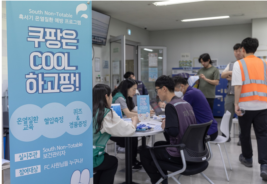
인천5센터 직원들이 혹서기 온열질환 예방교육 캠페인에 참여하고 있다.

쿠팡풀필먼트서비스 라이언 브라운(Ryan Brown) EHS(환경·안전·보건) 부문 대표이사는 “쿠팡은 현장 근로자들이 보다 나은 환경에서 일할 수 있도록 끊임없이 노력하고 있다”라며 “올여름 무더위가 예상되는 상황이라 회사는 모든 자원을 동원해 근로자들의 건강과 안전을 위해 최선을 다할 것”이라고 전했습니다.