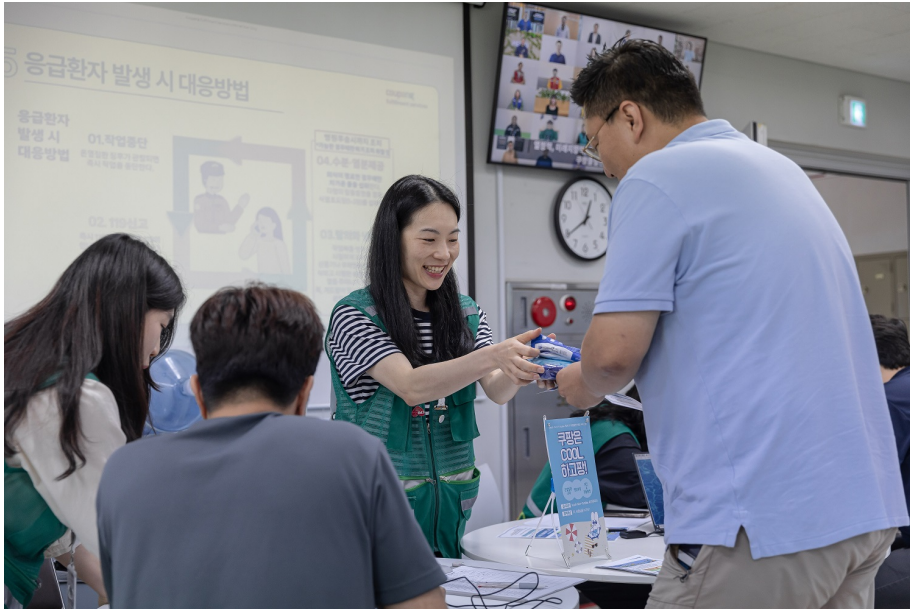
온열질환 예방교육을 받은 인천5센터 직원들은 '온열질환 예방키트'를 선물로 받았다.

온열질환 교육을 받고 퀴즈를 푼 직원들은 이온음료 분말과 쿨링 티슈 그리고 얼음 물병을 담을 수 있는 어깨끈 가방을 선물로 받고 환하게 웃었습니다.