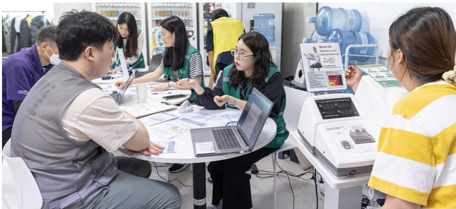
쿠팡 인천5센터 직원들이 사내 보건관리자의 안내에 따라 온열질환 예방교육을 받고 있다.