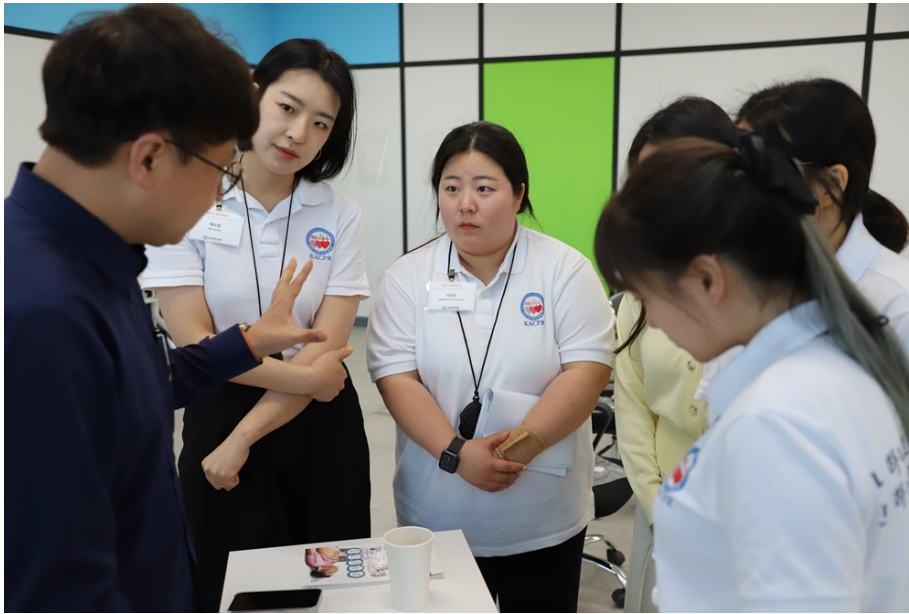
지난 5월 3일, 대한심폐소생협회 심사관이 쿠팡 인천14센터 안전교육장에 방문해 일반인 심폐소생술 교육기관 인증심사를 진행하고 있다. 심폐소생술 일반인 강사자격증을 취득한 쿠팡풀필먼트서비스 사내 보건관리자들이 심사관의 설명을 듣고 있다.

이번 교육기관 공식 지정으로, 앞으로 쿠팡풀필먼트서비스는 쿠팡 및 계열사 임직원을 대상으로 심폐소생술 교육 과정(기초/심화 과정)을 개설하고 운영할 자격을 갖게 됐습니다. 임직원들 입장에서는 생명을 살리는 꼭 필요한 기술을 회사에서 체계적으로 교육 받을 수 있게 된 셈입니다.