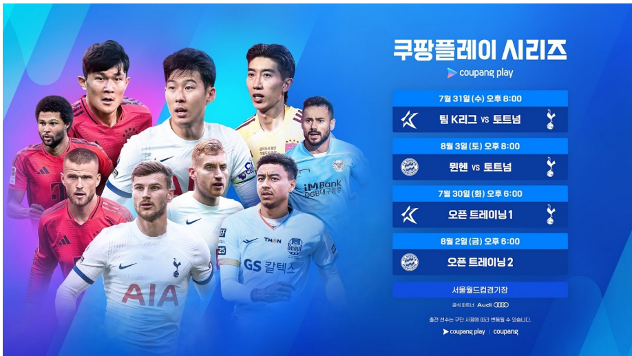
쿠팡플레이 시리즈 일정

2024 쿠팡플레이 시리즈에 대한 모든 정보는 쿠팡플레이 공식 사이트 에서 확인할 수 있다.