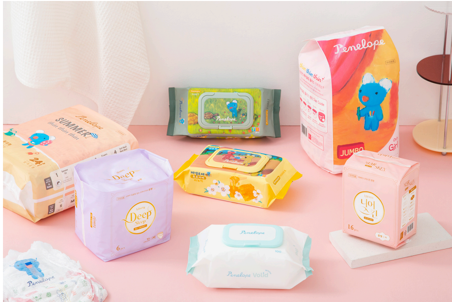
더퍼스트터치의 아기물티슈, 기저귀, 여성용품 등 유아용 제품들