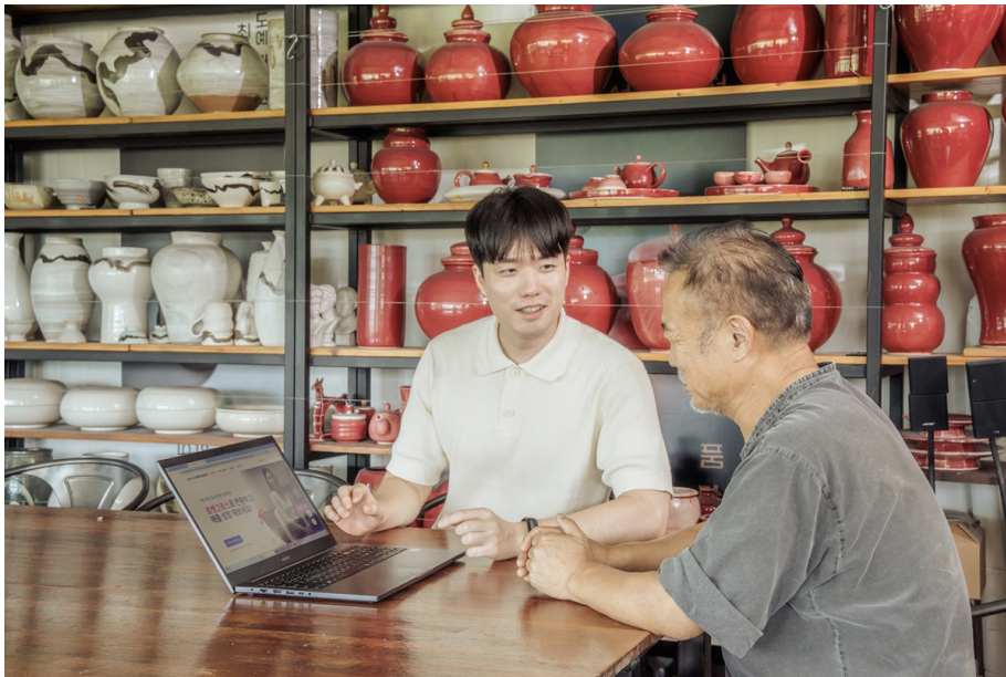
판매자를 위한 단계별 컨설팅을 제공하는 쿠팡 로켓그로스 담당자