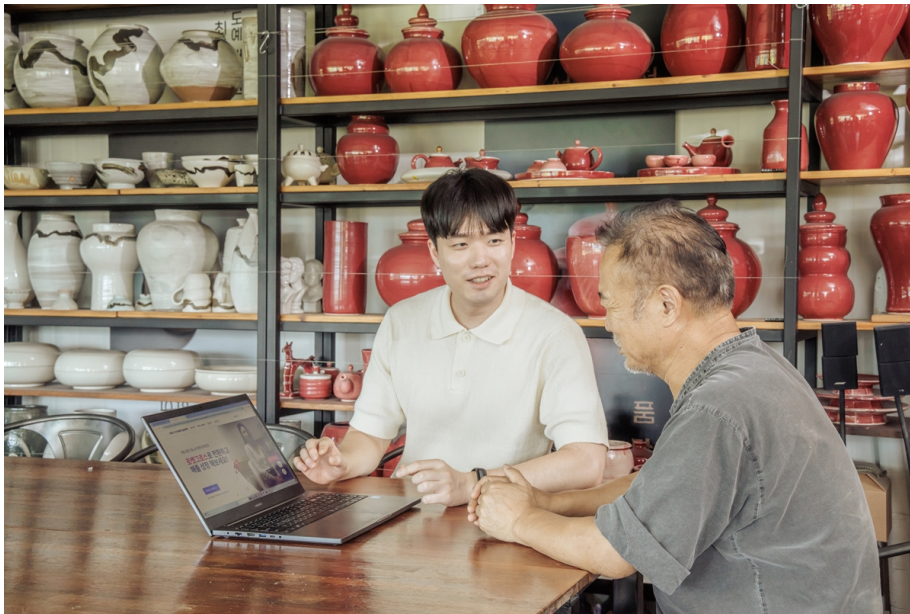
판매자를 위한 단계별 컨설팅을 제공하는 쿠팡 로켓그로스 담당자