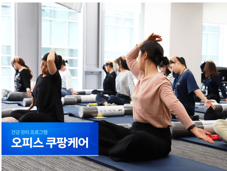
운동지도사의 지도를 따라 운동하는 오피스 쿠팡케어 프로그램 참가자들