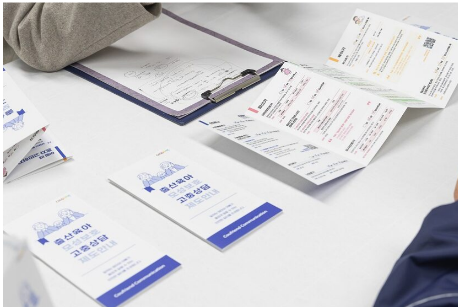
쿠팡렌드 커뮤니케이션팀에서 진행한 모성보호 상담 데이

2022년 기준, 육아휴직과 육아기 단축근로 사용 비율은 2020년 대비 약 4배 증가했습니다. 여성 배송 근로자의 생리휴가 사용 비율도 약 89%에 이릅니다. '모성보호제도' 덕분입니다.