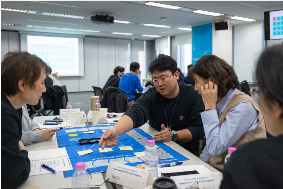
지난 8일, 서울 송파구 잠실 사옥에서 열린 CFS 팀 캡틴 리더십 특별 교육에 참여한 서울-경기권 FC 팀 캡틴들이 조별 활동에 참여하고 있다.

처음 만나 서먹하던 팀 캡틴들은 공통의 관심사인 FC 현장의 이야기를 나누며 가까워지기 시작했습니다. 올해 프로그램은 ‘현장직원과 통하는 대화법’을 중심으로 구성했는데요. 리더를 위한 마음 관리, 팀 리더로서 나의 말과 행동 성찰하기 등 실제 업무 현장에 적용할 만한 다양한 사례를 놓고 함께 논의하며 원활한 현장 운영을 위한 해답을 찾아갔습니다.