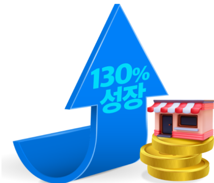
*수도권, 광역시 제외 지방지역 기준