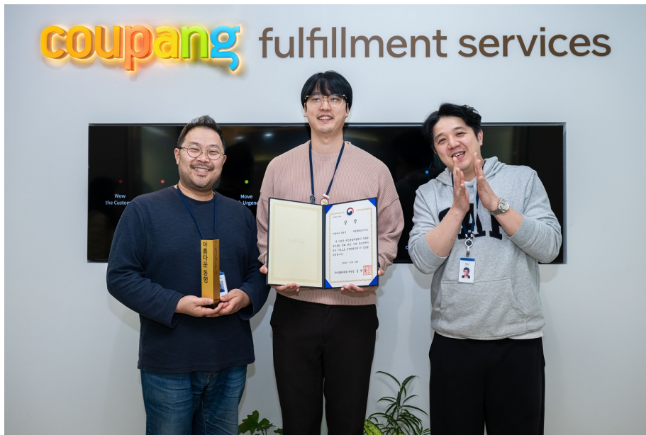
CFS 사회공헌활동을 기획하는 정책팀 팀원들. 임직원들에게 '2024 아름다운 동행상' 수상 소식을 알리기 위해 상패와 상장을 들고 기념 촬영하고 있다.

CFS 임직원들은 매달 지역사회와 이웃을 위해 수년째 봉사와 나눔을 행하고 있습니다.