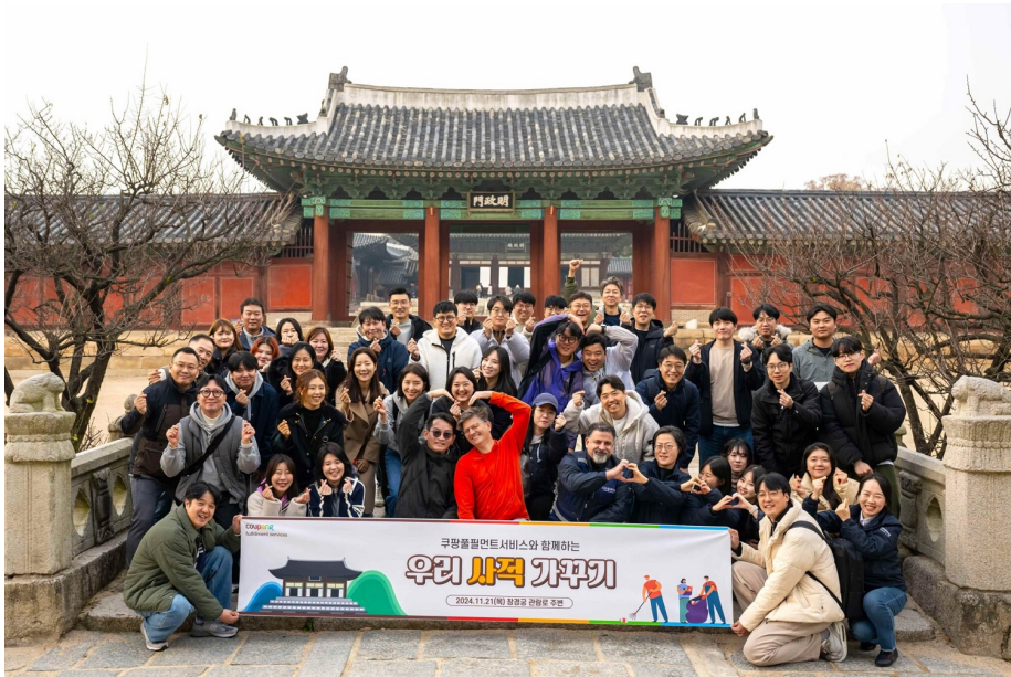
지난 11월 21일 서울시 창경궁 관덕정에서 쿠팡풀필먼트서비스 임직원들이 '우리 시각 바꾸기' 활동을 했다. CFS는 3년째 창경궁 환경 정화 활동을 이어오고 있다.

CFS는 서울 창경궁의 수목 보호를 위해 낙엽을 수거해 마대자루에 담아 정리하는 일, 에너지 취약계층에 연탄을 기부하고 배달하는 일도 3년째 꾸준히 진행하고 있습니다. 그뿐만이 아닙니다. 연말이 되면 전국 CFS 임직원들은 월급에서 천 원, 만 원, 삼만 원, 오만 원씩 형편 되는대로 기부금을 모아 소아암·백혈병 어린이 치료를 위해 서울대학교어린이병원에 전달합니다. 지난 2024년 연말엔 역대 최대 금액인 총 78,889,000원 임직원 성금이 모이기도 했죠.