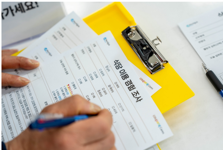
곤지암1센터 ‘나(Na) 다운(Down) 캠페인’ 결과, 웰빙국을 경험한 직원들의 91%가 “앞으로도 웰빙국을 선택할 의향이 있다”라고 응답했다.

이번 ‘나(Na)다운 캠페인’은 26일을 끝으로 마무리되었지만, 곤지암1센터 직원들의 건강 식생활을 위해 웰빙국과 나트륨 함량이 적은 라면은 앞으로도 계속 제공됩니다.