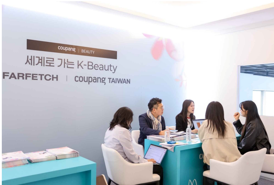
쿠팡 대만 뷰티팀이 K브랜드사 관계자들에게 대만 로켓배송 입점 절차에 대한 컨설팅을 진행하고 있다

한 중소 뷰티 브랜드 관계자는 “해외 진출 과정에서 유통망 확보가 가장 큰 과제였다”며 “쿠팡을 통해 대만 로켓배송과 파페치 입점을 함께 검토할 수 있어 큰 도움이 될 것 같다”고 말했다.