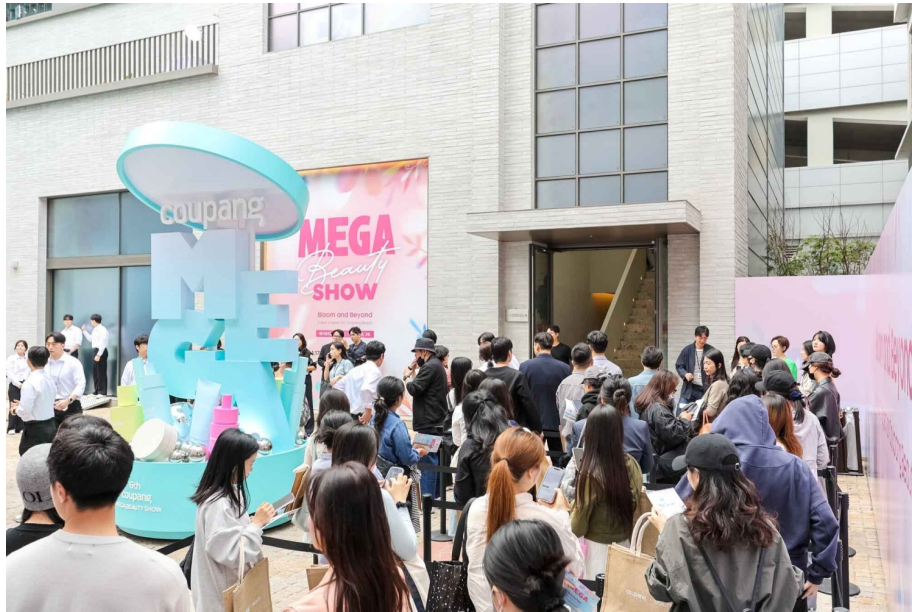
서울 성수동에서 열린 메가뷰티쇼 버추얼스토어에 입장을 기다리는 고객들이 줄지어 서 있다