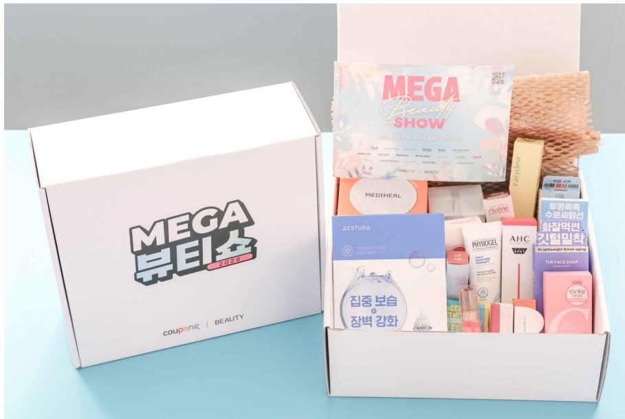
메가뷰티쇼 ‘버추얼스토어’ 방문객에게 제공되는 42만 원 상당의 뷰티박스

뷰티박스는 △닥터지 레드 블레미쉬 클리어 히알 시카 수딩 세럼 △에스트라 세라마이드 인텐스 시트 마스크 △AHC 프로샷 포어 이레이저세럼 △아벤느 오르페말 미스트 등 이번 행사에 참여한 브랜드 제품 19종으로 구성된다.