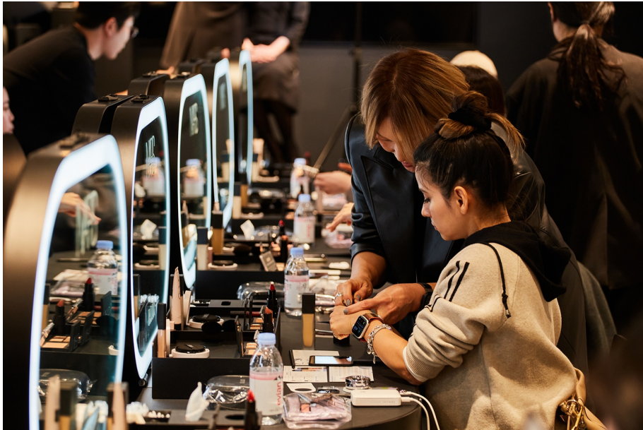
2층 뷰티 아뜰리에

2층은 뷰티 클래스와 셀프 체험존으로 운영됐습니다. 3월 2일까지는 셀프 체험존으로 운영돼 고객들은 혼자서 편안하게 여러 뷰티 제품을 사용해볼 수 있었으며, 그 이후부터는 뷰티 클래스에서 전문가에게 메이크업 팁, 향수 시향, 뷰티 제품 사용법 등 다양한 내용을 배울 수 있었습니다. 살롱 드 알렉스 뷰티 클래스는 업계 최정상 메이크업 아티스트 4인과 럭셔리 뷰티 브랜드 14곳과 함께 하며 한층 더 깊이 있게 나를 가꾸는 시간을 선사했습니다.