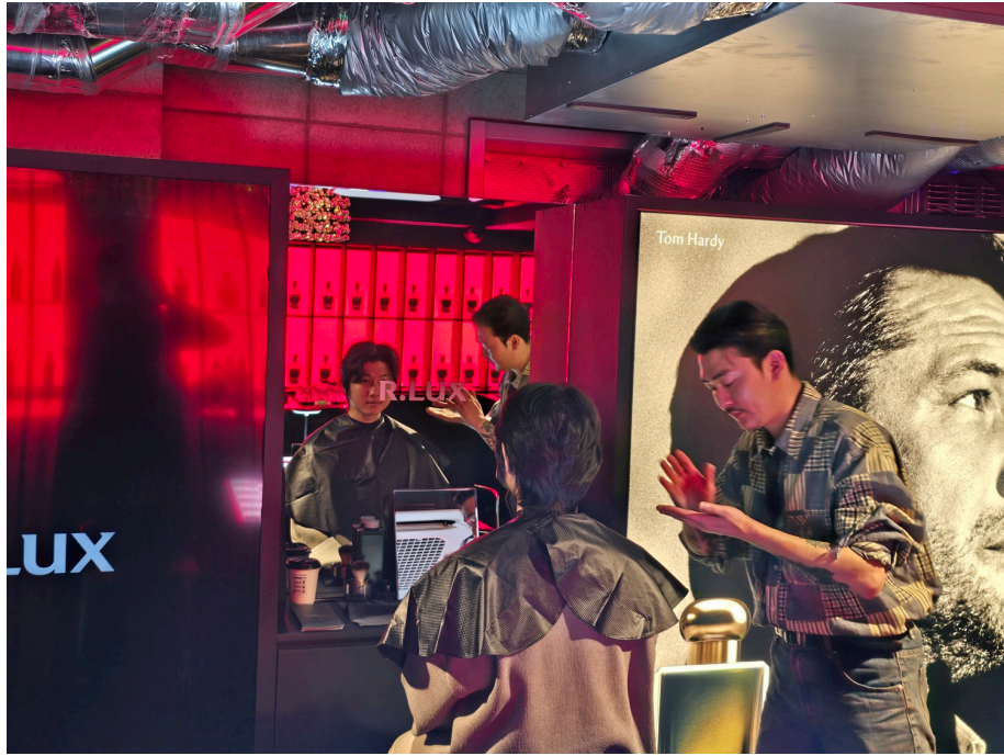
지하 1층 맨즈 케이브

지하 1층은 남성들을 위한 체험 공간으로, 바버 서비스, 위스키 클래스 등 맨즈 뷰티 및 라이프스타일에 집중한 프로그램이 마련됐습니다. 클라랑스, 비오템, 키엘, 킬리안 파리 등 주기적으로 협업 브랜드가 바뀌어 폭넓은 체험이 가능했으며, 바버 서비스와 위스키 클래스는 무료로 진행돼 남성 고객들도 쉽게 자신을 가꿀 수 있게 기회를 제공했습니다.