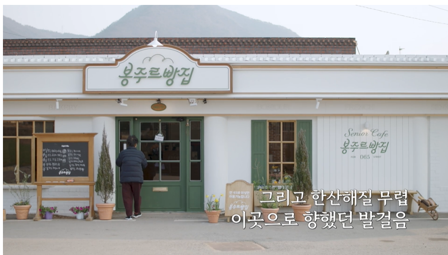
그리고 한산해질 무렵 이곳으로 향했던 발걸음