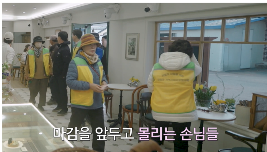
마감을 앞두고 몰리는 손님들

무엇보다 <봉주르빵집>이 선사하는 감동의 본질은 공간을 채운 사람들의 진솔한 이야기에 있었다. 손녀의 초등학교 회장 당선을 축하하러 온 할머니부터 손주와 나들이에 나선 가족들까지, 빵집을 찾은 어르신들의 소박한 일상은 그 자체로 드라마가 되었다. 특히 “나도 써먹을 데가 있구나, 나이 먹어도”라고 나지막이 읊조린 한 할아버지의 고백은 세대를 관통하는 뭉클함을 안기며, 단순한 예능을 넘어선 의미를 증명해 냈다.