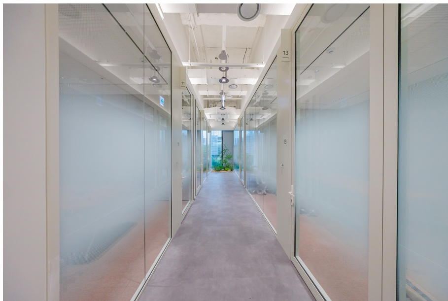
메인 라운지와 미팅 그라운드. 임직원은 물론 외부 방문객들과도 활발히 교류할 수 있게 디자인했다.