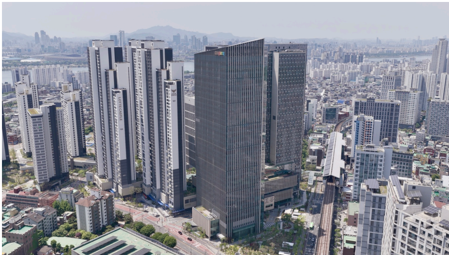
쿠팡 구의 오피스. 서울 지하철 2호선 구의역과 연결된다.

잠재력을 마음껏 펼치는 직원들, 기대를 가쁘히 뛰어넘는 고객 경험. 쿠팡이 이를 위해 구의 이스트폴 타워(EASTPOLE Tower)에서 새롭게 출발합니다. 쿠팡은 물입을 돕는 공간을 어떻게 만들었을까요? 쿠팡 구의 오피스를 소개합니다.