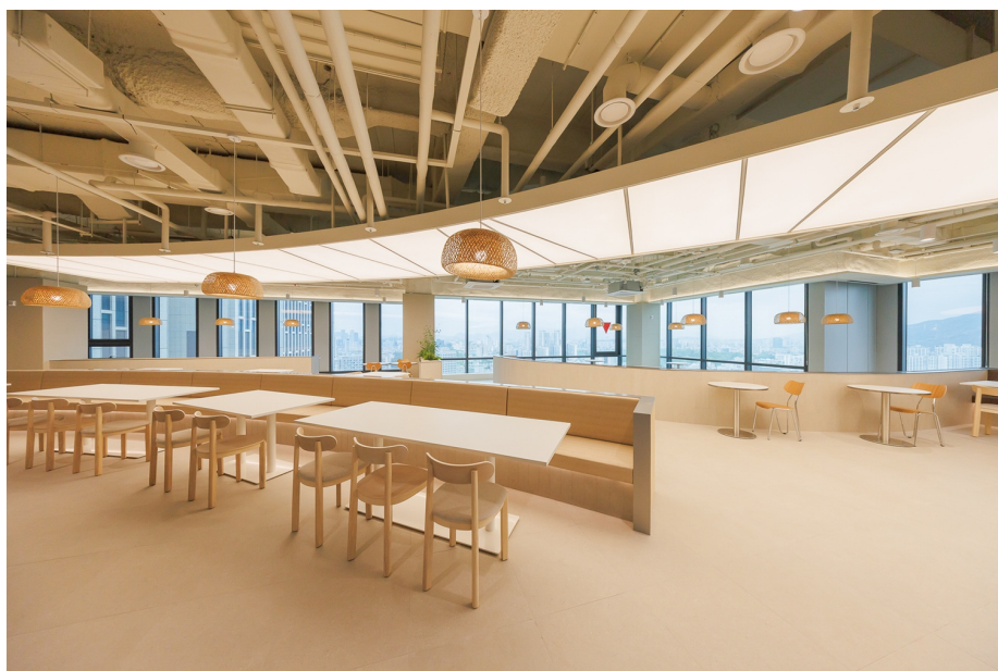
한강과 아차산이 훤히 보이는 '카페 프레시'. 모모스커피 등 스페셜티 커피 브랜드들과 종종 협업해 직원들이 프리미엄 원두를 즐길 수 있게 할 예정.