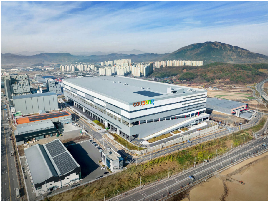
대구 3,7,8센터 전경 (대구 달성군 구지면)

현재 대구 지역의 7개 센터에는 올해 일학습병행과정을 통해 총 74명이 입사했습니다. 그중 16명(2026년 6월10일 기준)은 입사 3개월만에 정규직인 팀 캡틴으로 발탁되어 쿠팡의 물류 현장을 당차게 이끌어가고 있습니다.