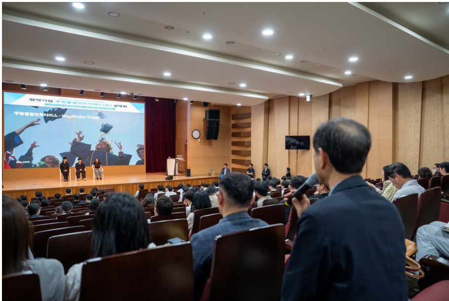
지난 27일 대구 영남이공대학교에서 열린 일학습병행과정 설명회에서 한 교사가 Q&A 세션에 나선 쿠팡풀필먼트서비스 최연소 팀 캡틴들에게 질문을 하고 있다.

CFS가 영남이공대학교와 함께하는 일학습병행과정은 대학과 기업이 협력해 현장형 인재를 조기에 양성하는 프로그램입니다. 고등학교 졸업 후 바로 입사해 약 1년간 근무하면 정규직 전환 기회가 주어지며, 일반 입사 대비 최대 2년 빠르게 오토메이션 엔지니어나 팀 캡틴 등 관리자로 성장할 수 있습니다.