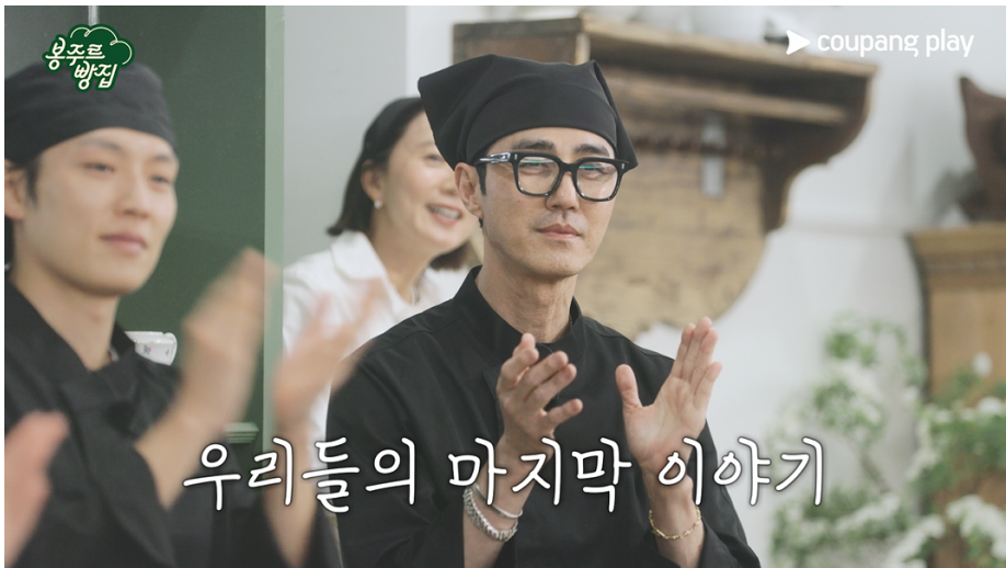
우리들의 마지막 이야기