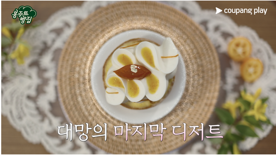
대망의 마지막 디저트