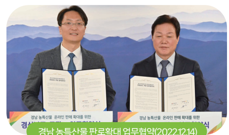
경남 농특산물 판로확대 업무협약(2022.12.14)