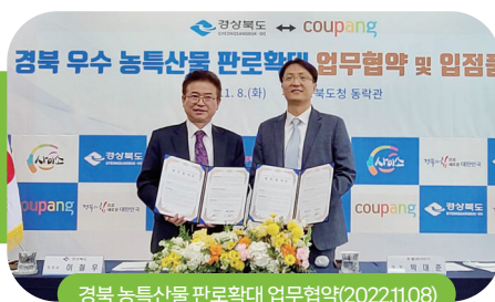
경북 농특산물 판로확대 업무협약(2022.11.08)